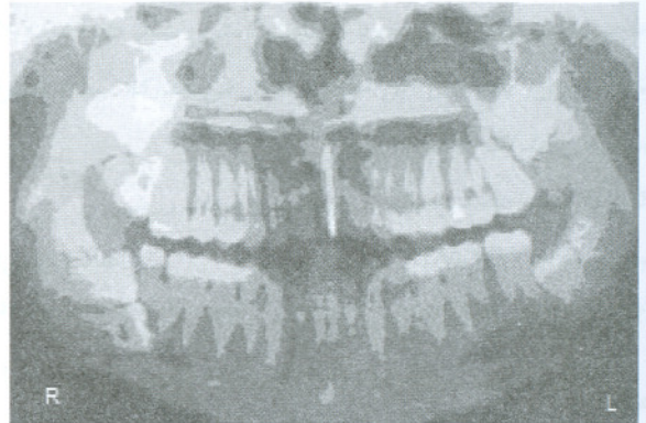
شکل ۱: تصویر پانورامیک دندانهای اضافی

در رادیوگرافی که بعد از جراحی انجام شد شکستگی‌ای دیده نشد (شکل ۲).