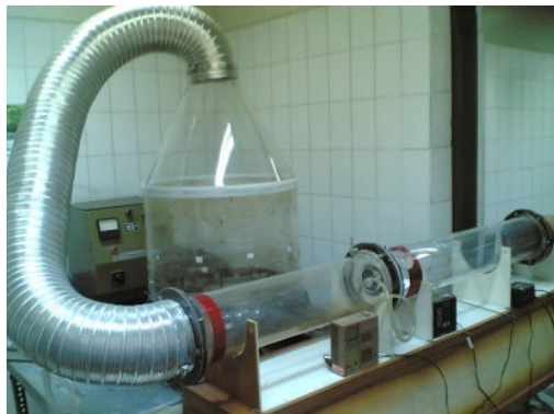
شکل ۱: وان آبکاری، محفظه استوانه ای و مخروطی هدایت کننده میست، لوله هدایت کننده میست به تونل تست و تونل تست

جهت تولید میست کروم شش ظرفیتی از یک مولد میست کروم که از یک وان آبکاری، ساخته شده بود، استفاده گردید (۹). حجم این وان ۲۲۰ لیتر و حجم محلول داخل آن مشتمل بر اسید کرومیک و اسید سولفوریک حدود ۲۰۰ لیتر بود. تراکم الکترولیت داخل آن ۲۵۰ گرم در لیتر مشابه شرایط واقعی وان آبکاری کروم سخت در صنعت انتخاب شد. به منظور کنترل شرایط نمونه برداری، محفظه ای از جنس پلکسی گلاس در بالای تولید کننده میست نصب گردید و میست تولید شده به سمت تونل تست فیلتر هدایت شد (شکل ۱).