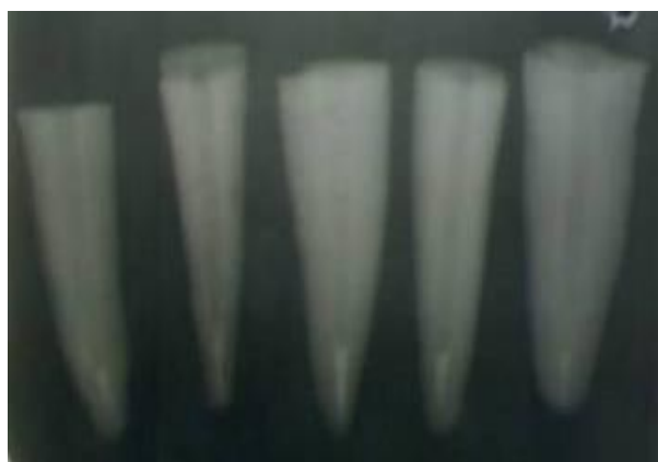
شکل ۱- تهیه رادیوگرافی جهت بررسی کیفیت پلاگ MTA

دندان‌ها به ۴ گروه ۱۰ تایی تقسیم شدند. در گروه ۱، تمام طول کانال به روش تراکم جانبی با گوتاپرکا و سیلر AH26 پر شد. سپس با استفاده از اینسترومنت داغ ۱۰ میلی‌متر گوتای کروئال تخلیه و قسمت آپیکال به وسیله پلاگر تراکم شد به گونه‌ای که پلاگ آپیکالی به ضخامت ۵ میلی‌متر باقی بماند. در گروه ۲، ۳ و ۴ به ترتیب ناحیه آپیکال به صورت مستقیم (دسترسی تاجی) با استفاده از Pro root