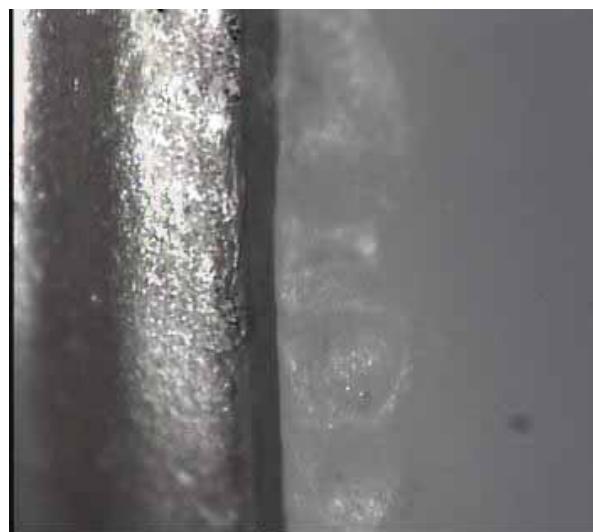
شکل ۴- تصویر تهیه شده از لبه کور و مدل آزمایشی توسط استریومیکروسکوپ