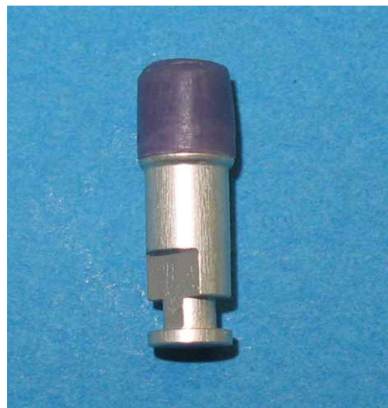
شکل ۲- مدل مومی finish شده روی مدل آزمایشی

درنهایت، مدل مومی روی مدل آزمایشی توسط یک برنیشر finish شد (شکل ۲).