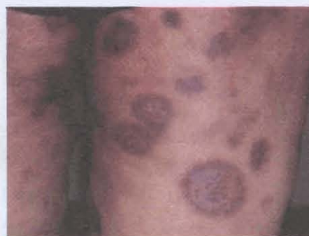
شکل ۱- ضایعات پوستی متعدد در دو نمای کمره شده از باسن‌ها.